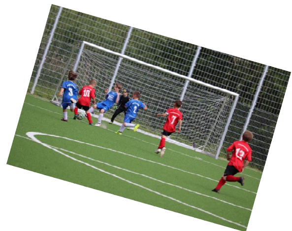
Die Jungfalken gegen Premnitz und Treuenbrietzen