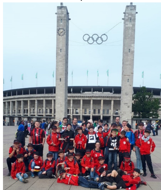
Eines der Saisonhighlights: Schülerländerspiel im Olympiastadion

abgeschlossen. Insgesamt konnten 5 Siege errungen und gefeiert werden. Nicht alle Niederlagen waren zum Schluss eindeutig, einige gingen wirklich knapp aus. Das Wichtigste ist aber wohl, dass die Kinder stets in einem motivierenden Umfeld trainieren und spielen konnten.