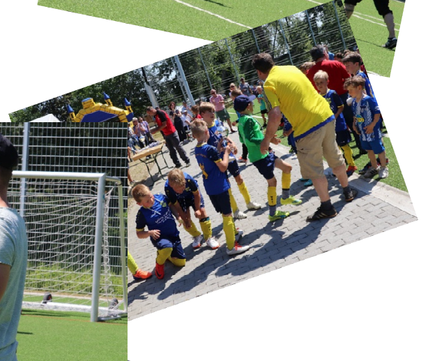
Und dann darf er noch die Sieger ehren, hier der Doppelsieger vom Werderaner FC und der Gewinner der goldenen Ananas