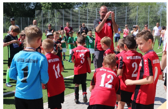
Turniersieger Optik Rathenow